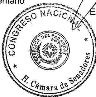
Martín Arévalo Vicepresidente 1º En ejercicio de la Presidencia H. Cámara de Senadores