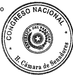
Blas Antonio Llano Ramos Presidente H. Cámara de Senadores

A Su Excelencia Señor Don Eduardo Petta San Martín Ministerio de Educación y Ciencias.